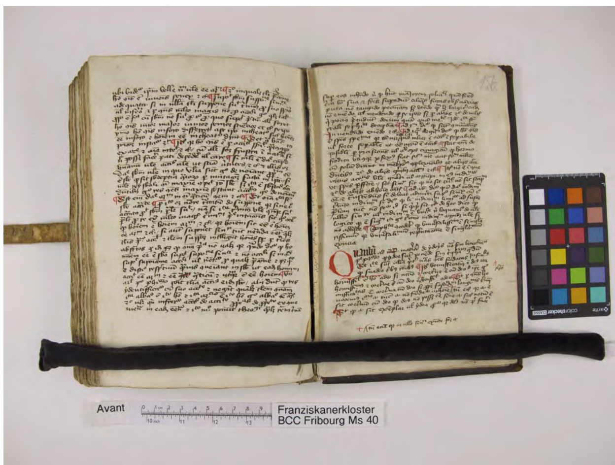
BCC Freiburg, Ms 40: Sammelhandschrift (1424). Papier und Pergament, 167 Blätter, 21.5 x 14.5 x 4.5 cm.

Die Beiträge werden von der Stiftung für die Renovation und den Unterhalt des Franziskanerklosters Freiburg verwaltet und sind steuerlich absetzbar. Die Namen der Stifter und Stifterinnen werden im Band verzeichnet.