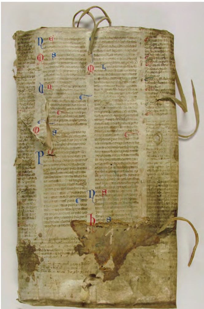
BCCFribourg, Ms 19: Sebastian Werro, Cahier de collège (Fribourg-en-Brigau, 1573). Papier, 140 feuilles, 31 x 21.4 x 3.5 cm.

Les contributions sont gérées par la Fondation pour la rénovation et la conservation du Couvent des Cordeliers Fribourg et peuvent être déduites des impôts. Les noms des donateurs et donatrices seront mentionnés dans le volume.